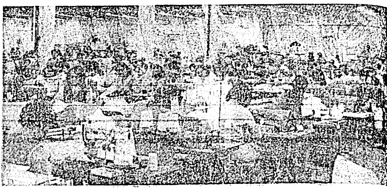
Întreprinderea „Tricoul roșu”. Aici, în secția confecții a fabricii, se finalizează apreciatele tricouri arădene.