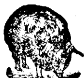
După folo înță.