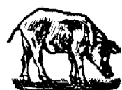
Neinte de folosință.