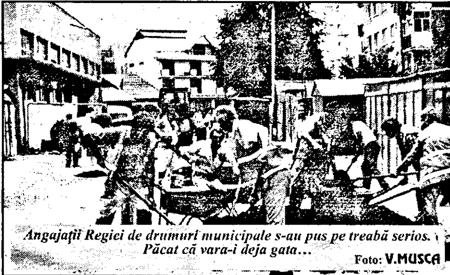
Angajații Regiei de drumuri municipale s-au pus pe treabă serios. Păcat că vara-i deja gata...