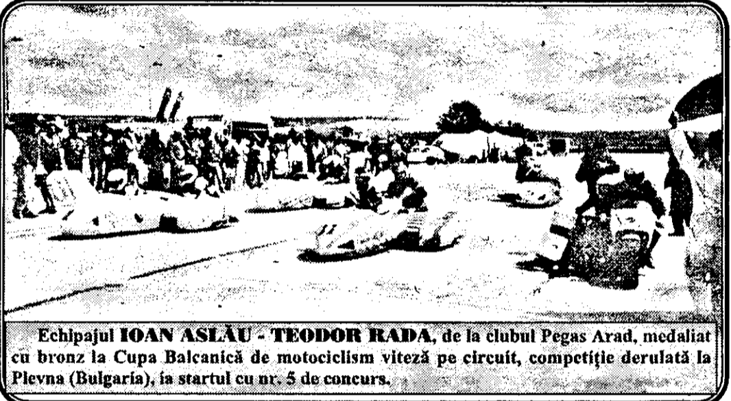
Echipajul IOAN ASLAU - TEODOR RADA , de la clubul Pegas Arad, medaliat cu bronz la Cupa Balcanică de motociclism viteza pe circuit, competiție derulată la Plevna (Bulgaria), la startul cu nr. 5 de concurs.