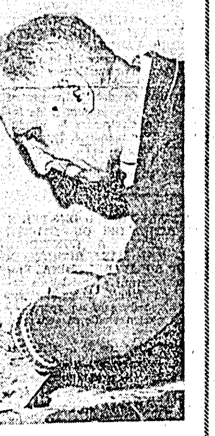
Artistul amator la masa de lucru.