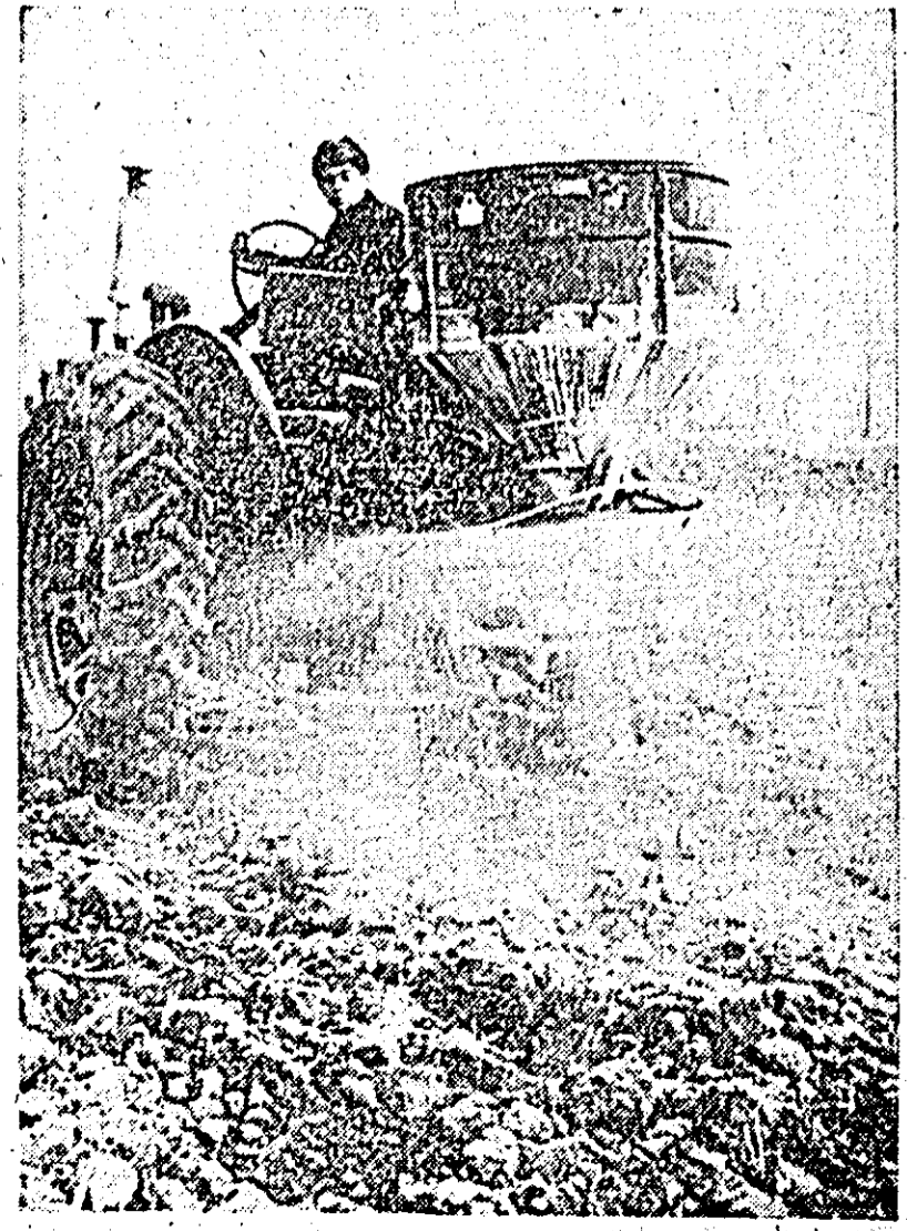
La C.A.P. Iratoș se asigură de pe acum condiții prielnice pentru viitoarea producție. ÎN CLISEU: unul din mecanizatorii de la SMT Curtici îm-prăștiînd îngrășămintă chimică.