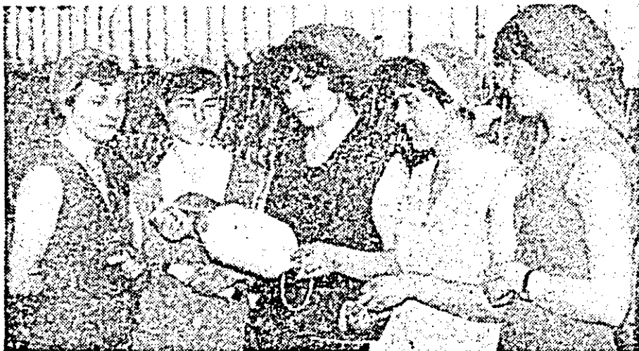
Satisfacția datoriei împlinite, bucuria de a face parte din rîndurile unui colectiv muncitoresc reprezentativ al Industriei arădene — iată doar câteva din stările de conștiință ale acestor tineri din cadrul secției filatură a întreprinderii textile.

● Peste 2.600 de uteciști de la I.S.A., fabricile de strunguri din Chișineu Criș și Lipova, C.P.L., I.V.A., U.T.A., „Tricolor roșu”, „Libertatea” și „Arădeanca” au realizat, în perioada 15—20 martie a.c., bunuri materiale în valoare de aproximativ 1.200.000 lei.