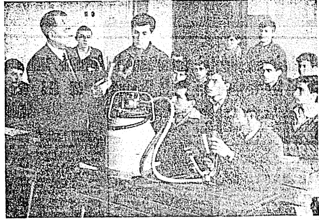
La școala de mecanici agricoli din comuna Ortșoara elevii își însușesc tainele frumoasei meserii de mecanizator. Pe lângă materiile de cultură generală ei învață noțiunile, minuirea întregului utilaj folosit în agricultură.