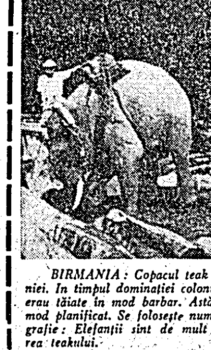
BIRMANIA: Copacul teak constituie una din bogățiile Birmaniei. În timpul dominației colonialilor, cantități masive de teak erau tăiate în mod barbar. Astăzi, exploatarea pădurilor se face în mod planificat. Se folosește numai lemnul total maturizat. În fotografie: Etefanții sînt de mult folos muncitorilor de la exploatarea teakului.

POPORUL VENEZUELEI SE PRONUNȚĂ ÎNTR-UN VIZIUNE IMEDIATĂ A TITULUI COMERCIAL CI SUA, A DECLARAT PREȘEDINTELE COMISIEI PENTRU AFACERI EXTERNE, JAMES MURPHY, în Camera Deputaților la Congresul venezuelez. El a chemat parlamentul să adopte o rezoluție în spiritul tenției președintelui țării de formula unei reforme economice la conferința șefilor de stat și guverne membre ale OSA care urmează să se deschidă la Punta del Este (Uruguay).