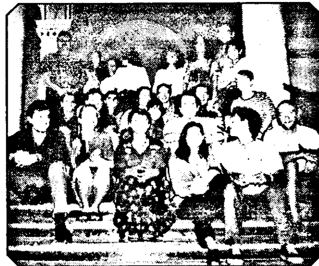
Tinerii din Est și Vest și-au dat mâna la Arad.