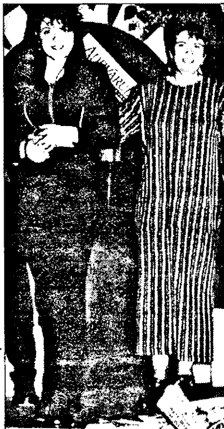
Doă fetei fericite...

După extragerea excepțională a urmat dansul. În valuri, trup lângă trup,