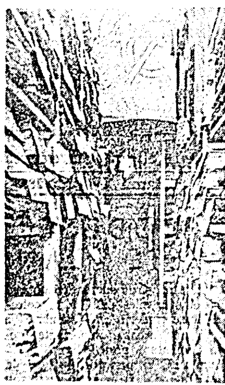
Un harnic colectiv de cercetători istorici își desfășoară activitatea în cadrul unei tinere instituții din orașul nostru...