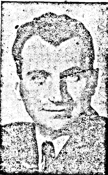
D. LUCRETIU PATRASCANU

Acionul Tars care l-a adus pe d. ministru de interne a aterizat la orele 15. D. ministru Teohari Georgescu a descins din