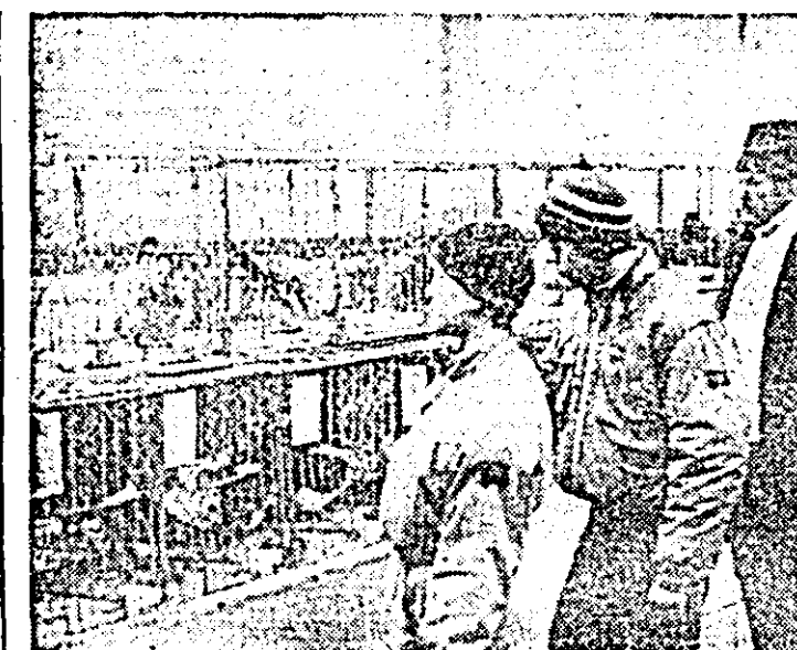
În localul din Bulevardul Republicii nr. 93 s-a deschis o nouă și interesantă expoziție organizată de Asociația columbofilă Arad.

Cum s-a ajuns la o asemenea stare de lucruri? Cum se explică deriva, altă de timpurie, la mai puțin de 18 ani împliniți, a lui Marcel T.? Unde și cînd s-a greșit, cine poartă oare vina pentru surprinzătoarea degringoladă a unei vieți încă neîncepută? Întrebări la care orice anchetă este greu