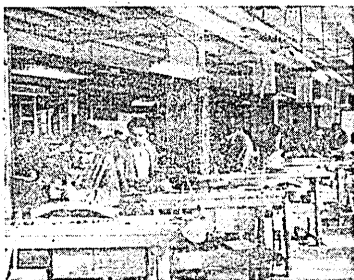
Aspect cotidian de muncă în secția a V-a sculptură a Combinatului de prelucrare a lemnului Arad.