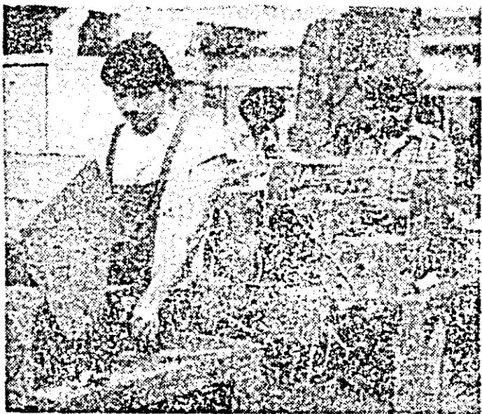
Aspect de muncă în secția montaj a I.M.U.A.