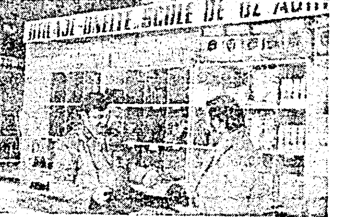
Unitatea metalo-chimică din Lipova oferă în aceste zile solicitanților o gamă largă de articole de uz gospodăresc.

să se fi anunțat din timp pentru a se trimite mai multe discaruri. Așadar, se mai ivesc unele neregulii în desfășurarea muncii, deși cu mai mult spirit organizatoric ele puteau fi eliminate. De asemenea, se cere extins semănatul porumbului, întocmai ca la ferma a III-a vegetală din satul Pescari, și în alte ferme din unitățile ale consiliului.