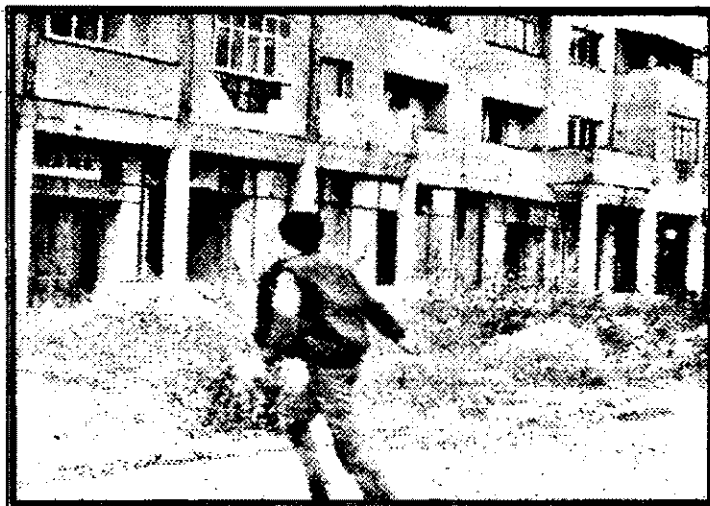
Ca peste tot se stagnează. De ce? Pentru că Primăria nu a ieșit din hibernarea cea lungă. Spre exemplificare - blocul Z-27 - din Calea Aurel Vlaicu.

de critice la adresa lui Ion Luca Caragiale. Volumul îngrijit de Barbu Cioculescu a trebuit să aștepte aproape 20 de ani pentru a putea apărea, la Editura Fundației Culturale Române. Terminat în 1985, pentru a marca 100 de ani de la nașterea lui Mateiu Caragiale, el s-a aflat în planul editurilor „Minerva” (care îl comandase) și „Eminescu”. După revoluție, singura care s-a arătat interesată a fost Editura Fundației Culturale. Aceasta a publicat-o însă fără secțiunea de receptare a operei și cu ceea ce Barbu Cioculescu numește „un aparat de note strict sufficient”, dar minimal. Volumul cuprinde o „Introducere” voluminoasă, ce include și o biografie, prima referitoare la Mateiu Caragiale. „Dacă e să ne gândim la impactul acestei ediții, Mateiu Caragiale are o aură magică, e un scriitor fără vreme”, a declarat în exclusivitate Agenția MEDIAFAX Barbu Cioculescu. „Poate fi citit în orice epocă, deși el s-a considerat un conservator, inclusiv în literatură. Și, mai cu seamă, poate da naștere la interpretări pe măsura mentalității fiecărei generații, de la perspectiva semiologică la cea ezoterică, a lui Vasile Lovinescu.”