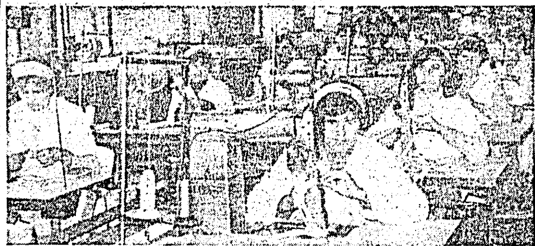
Aspect de muncă în atelierul pregătirii-cusut al întreprinderii „Libertatea”.