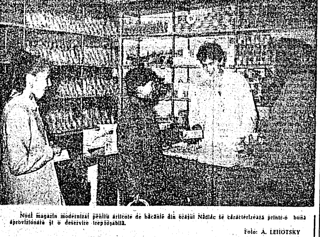
Noul magazin modernizat pentru articole de băcănă din orașul Nădlăc se caracterizează printr-o bună aprovizionare și o deservire treptabilă.