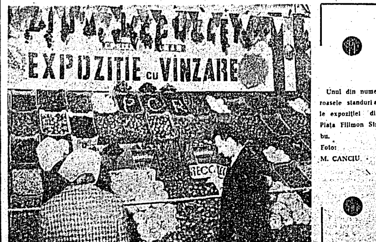
Unul din numeroasele standuri ale expoziției din Piața Filimon Str. bu.

Manifestările culturale și artistice ce au însoțit aceste frumoase succese au fost închinete fruntesilor, tuturor evidențiatilor, acelor care prin muncă rodnică au pus și pun temelie recoltelor mari, sarcina principală trasată lucrătorilor din agricultură de către conducerea partidului.