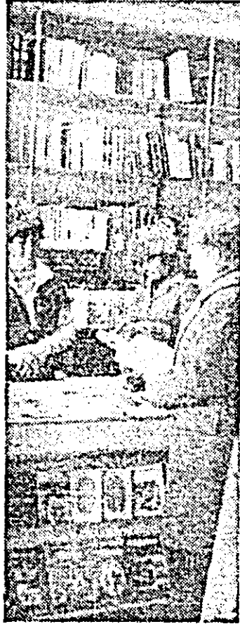
Aspect din librăria nr. 5 recent deschisă în cartierul Aurel Vlaicu din municipiu.