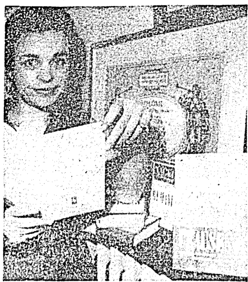
În Franța a apărut lucrarea președintelui Consiliului de Stat al României — Nicolae Ceaușescu, „Politica de pace și cooperarea internațională” în editura Nagel.