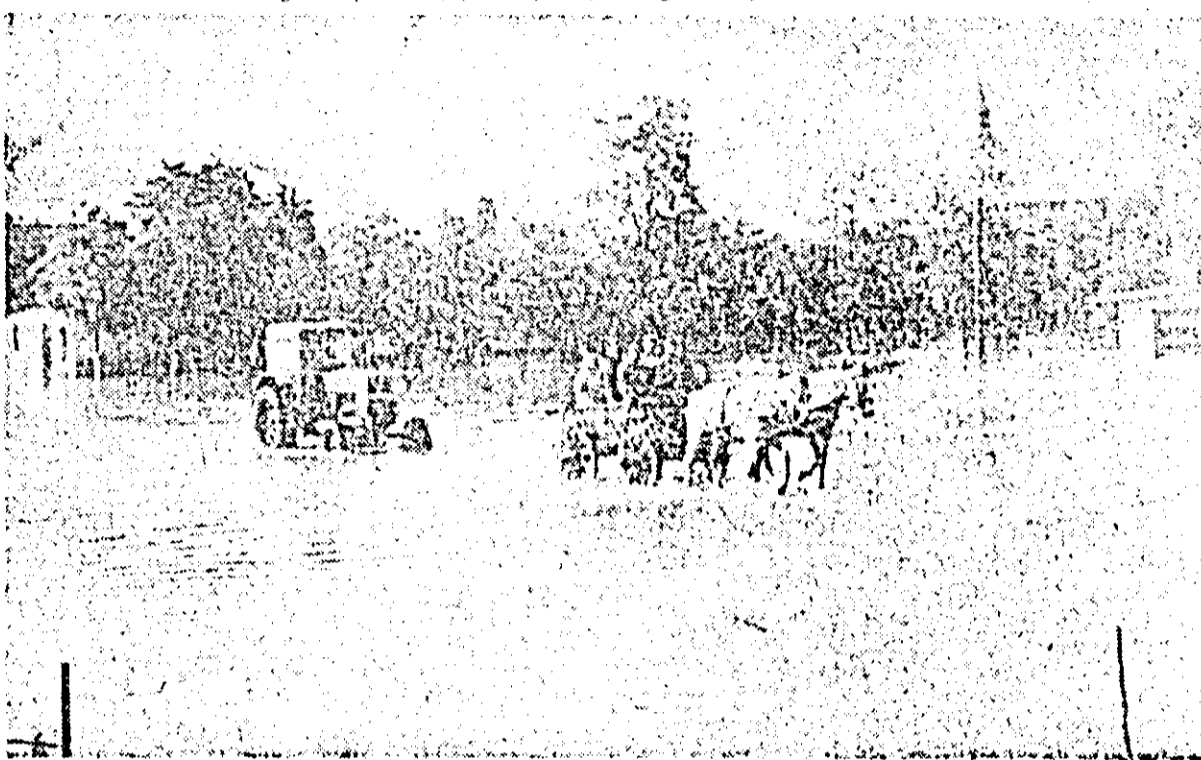
În centrul comunei Vinători inundat de ape.