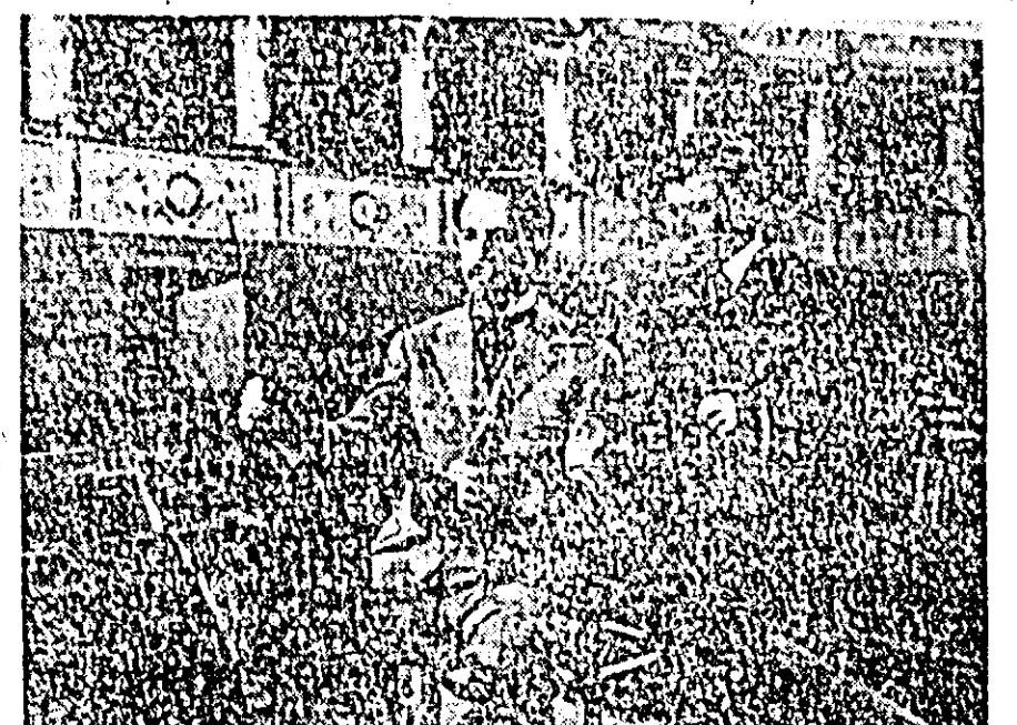
IN CLIȘEU: o scenă din filmul „Melodii nemuritoare”.

Filmul ne înfățișează numeroase momente din viața rememulului compozitor, autorul operelor „Cavaleria rusticana”, care și-a câștigat glorie și prețuirea omenirii.