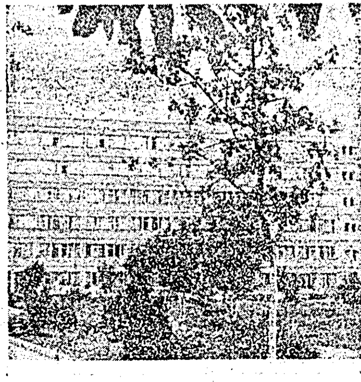
Spitalul Județean Arad. Vedere exterioară.