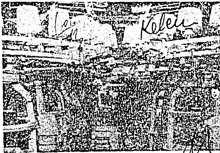
Întreprinderea „Tricoul roșu”. Instantaneu de muncă din sectorul mașinilor Interlock, unde se produce tricoul pentru confecționarea costumelor de baie.