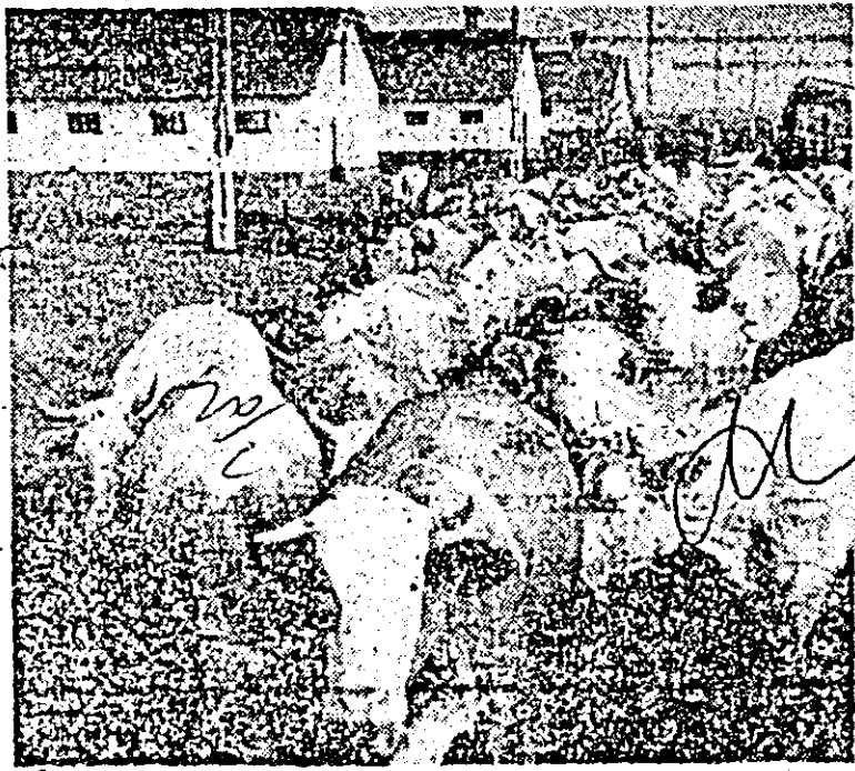
La cooperativa agricolă din Șeitin s-au luat din timp măsuri pentru țineră în bune condițiuni a animalelor.