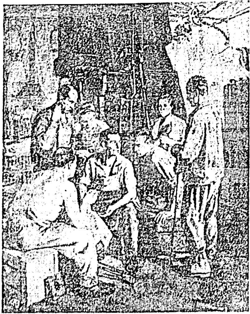
Gh. Freiberg: CITIREA "SCINTEII" ÎN UZINA.