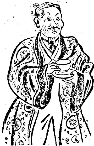
HIROTA japán külügyminiszter

A londoni Daily Express arról ír, hogy Hirota japán külügyminiszter rövidesen lemond és utóda Tategava tábornok, a nacionalisták vezére lesz, aki erős angol ellenes politikát fog sürgetni. Szó van arról, hogy a hadügyminiszteri tárcában is változás fog történni és Arki tábornok a háborús párt feje veszi át a hadügyminiszterium vezetését.