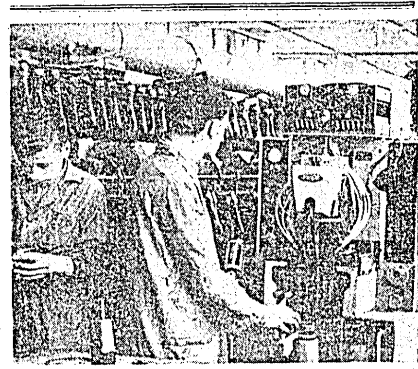
Secvență de muncă la fabrica Libertatea. Se lucrează la noua mașină de tras căleți.