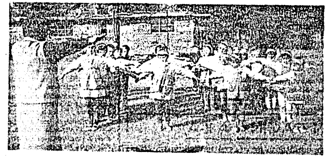
Primele luni de școală înseamnă și formarea primelor deprinderi din viața de elevi. ÎN CLISEU: Ora de gimnastică la școala generală nr. 8.

Sintetizând concluziile consfătuirii, se impune să relevăm că alt rețetel, celelalte informații prezentate, mesa rotundă organizată de redacția revistei „Familia”, cit și discuțiile care s-au purtat, au reușit să cuprindă o arie largă de probleme privind activitatea cenaclurilor literare și în același timp au fost jalunate principalele direcții ale activității de viitor a acestora. Cenaclurile literare vor trebui să devină forme și mai vii, și mai active de cultură populară multilaterală a tuturor membrilor — muncitorii, cooperatori, intelectuali și elevi —, în același timp să fie îndreptate competent în creșterea acestora. Consfătuirea a subliniat că profesorii de limba română vor trebui să deschidă mai frecvent ușile cenaclurilor literare, să vină și să explice incertitudinile tinerilor, creatori, să-i ajute să înțeleagă principiile probleme legate de creșterea literară. De asemenea, cenaclurile literare vor trebui să sprijine mai mult mișcarea artistică de amatori, brigăzile artistice de agitate și eclucuburile. Prin aceasta se asigură posibilitatea de apropiere a tinerilor creatori de treamțul adevărat al vieții, principalul izvor al creației artistice.