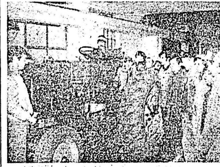
Mecanizatorul de la T.A.S. „Scintea", la o lecție practică în cadrul învățămîntului agrozootehnic.