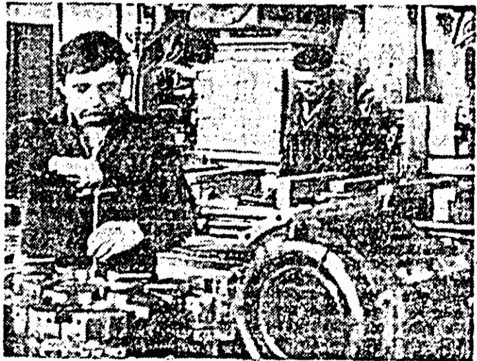
Aspect de muncă în secția strung mijlociu a I.M.U.A.