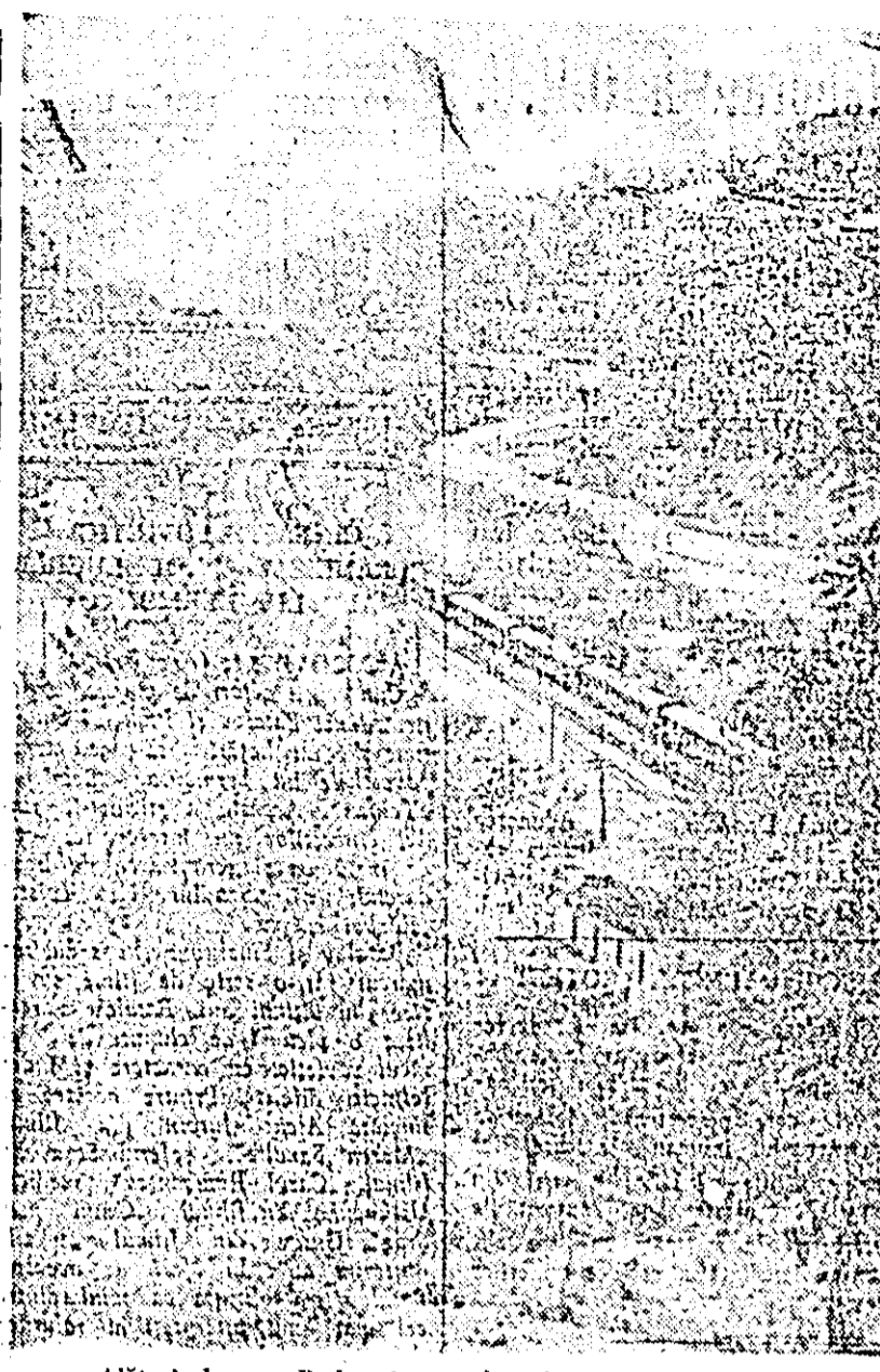
Alături de apa Fuluivei se potrivește liniile ferate.