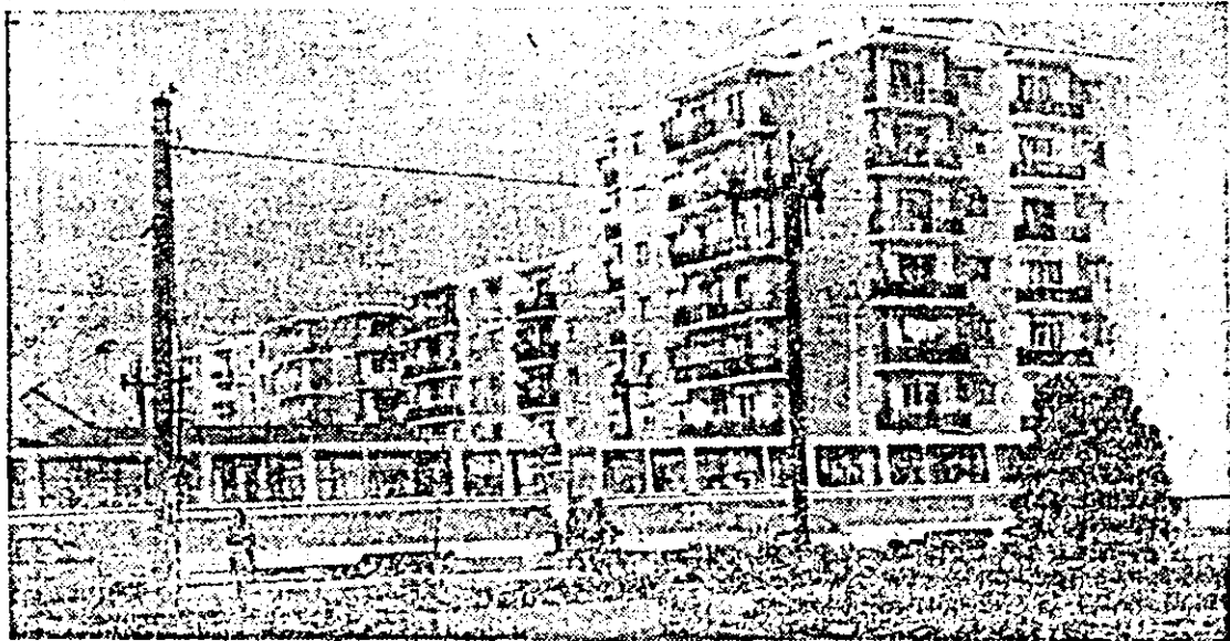
Imagini noi într-un vechi cartier al municipiului Arad: Micălaça.