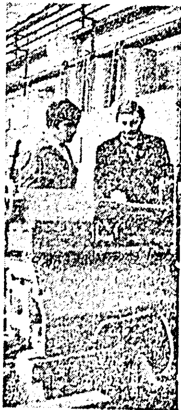
În secția montaj a I.M.U. se execută ultimile lucrări la un nou lot de strunguri destinate beneficiarilor externi.