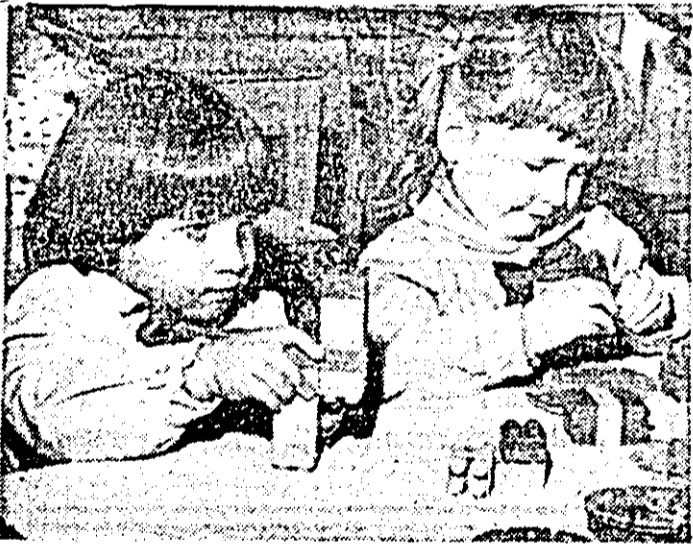
Și noi construim... (instantaneu la Grădinița nr. 6 Arad).