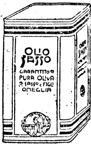
Sasso-bödön zöld szm, kék és fehér csikozással.

SASSO OLAJ vegyi elemzéssel szavatolt tiszta olajbogyóból való. —