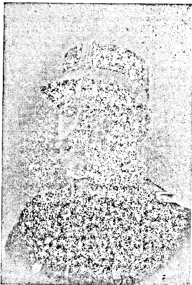
„Pentru repetate acte de vitejie și destoinicie în conducerea trupelor”.

Pentru aceste splendide fapte de arme și de jertfă, a fost decorat cu Ordinul „MIHAI VITEAZUL” clasa III-a, în ziua de 14 Octombrie 1916, cu mențiunea: