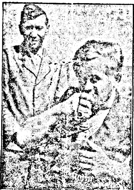
CAMARADERIA. — O scenă din filmul de mare succes: „Submarinele atacă” și care a avut de curând la cinematograful „Capitol”.