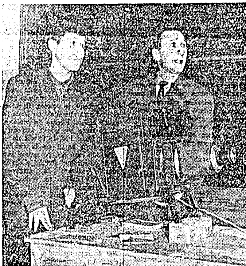
ÎN CLIȘEU: Cu ajutorul eplidiascopului elevilor le sînt prezentate imagini ale Aradului din trecut și de azi.