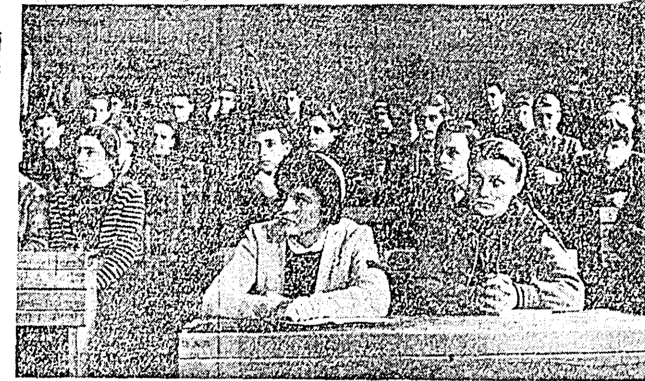
ÎN CLIȘEU: Aspect din cl. a IX-a D a Școlii medii nr. 1 în timpul lecției de dirigințe.

Pentru ca elevii muncitori de la secția serală a Școlii medii nr. 2 „Olga Bancic” să încheie primul trimestru al anului școlar în curs cu rezultate bune la învățătură, conducerea școlii a manifestat o preocupare serioasă pentru îmbunătățirea frecvenței. În acest scop au fost utilizate metode variate, printre care o legătură permanentă între școală și întreprinderi, analiza frecvenței în mod periodic etc. Un ajutor prețios la îmbunătățirea frecvenței l-au adus și profesorii diriginți care prin vizitele făcute la domiciliul elevilor sau