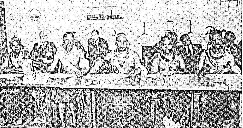
La Londra s-au desfășurat recent tratative în problema vitorului regim constituțional a Swazilandului. Conducătorii africani (care în mod demonstrativ au participat la tratative în jurul vestimentară și cu podoabele tradiționale africane) au cerut ca protectoratul britanic Swaziland — situat în sudul Africii, la granița dintre Republica Sud-Africană și colonia portugheză Mozambic — să își se acorde postulitate de a se autoadministra și, în cele din urmă, independența deplină.