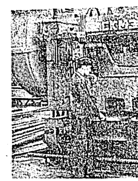
În ultimii ani, fabricile și uzinele din țara noastră au fost înzestrate cu mașini și utilaje moderne, de mare productivitate, primite din Uniunea Sovietică.

De curînd, la atelierul de pregătire al secției vagonaj de la uzinele „Gheorghe Dimitrov” a fost pusă în funcțiune o foarțecă tip ghilotină, de construcție sovietică. La această mașină plăcile de oțel de o grosime de 20 mm. și o lățime de 2.000 mm. sînt tăiate cu ușurință în diferite forme.