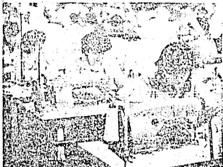
Secvență din activitatea secției confecțiilor a întreprinderii „Tricoul roșu” Arad.