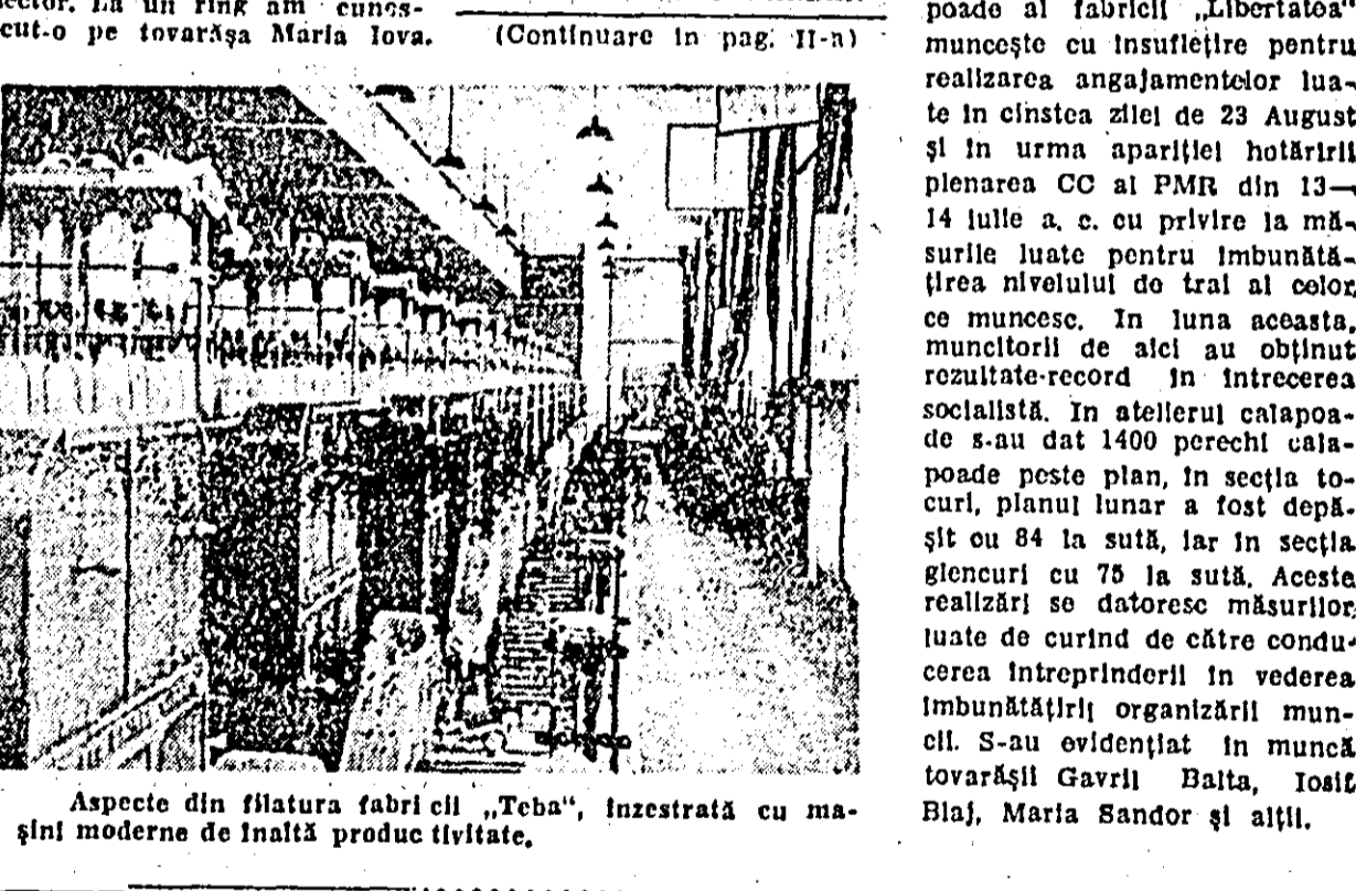
Aspecte din filatura fabricii „Teiba”, înzestrată cu mașini moderne de înaltă producție.