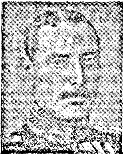
X. KERESZTÉLY, dán király

Illetékes helyen a dán királynak Hitlerrel tett látogatásával kapcsolatban kijelentették, hogy csupán udvariassági aktusról volt szó.