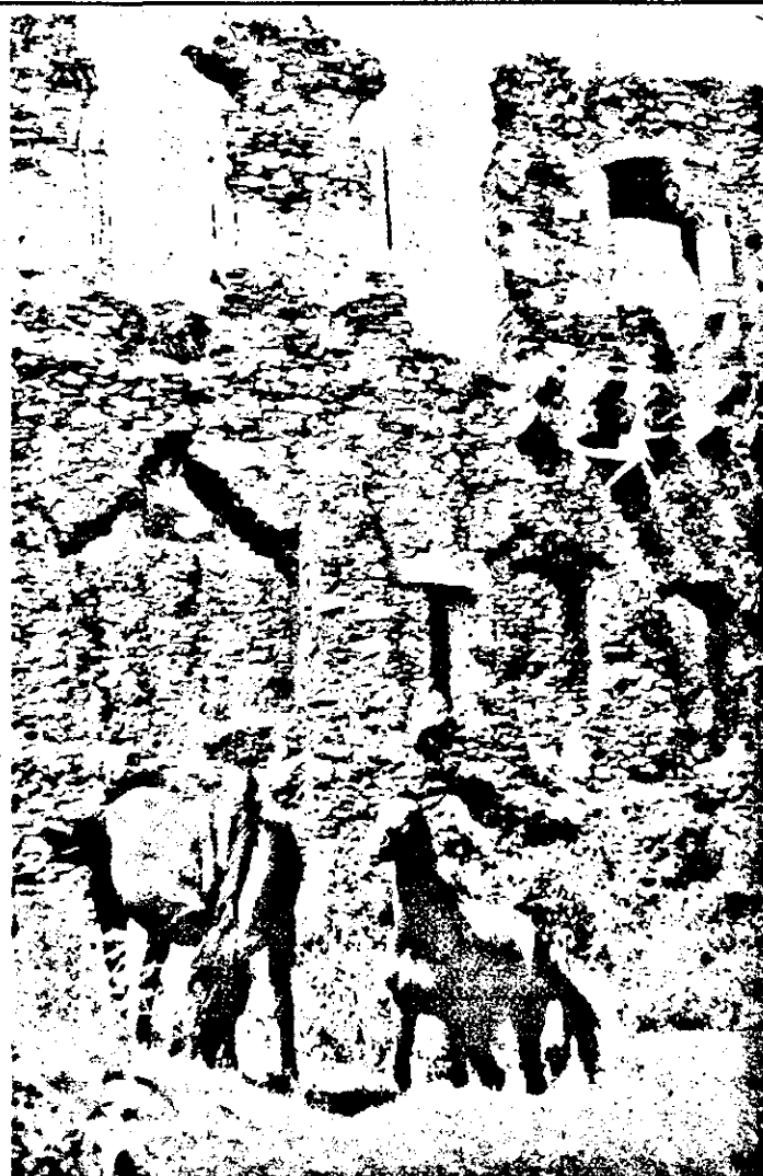
La poalele cetății și caii sunt mai frumoși