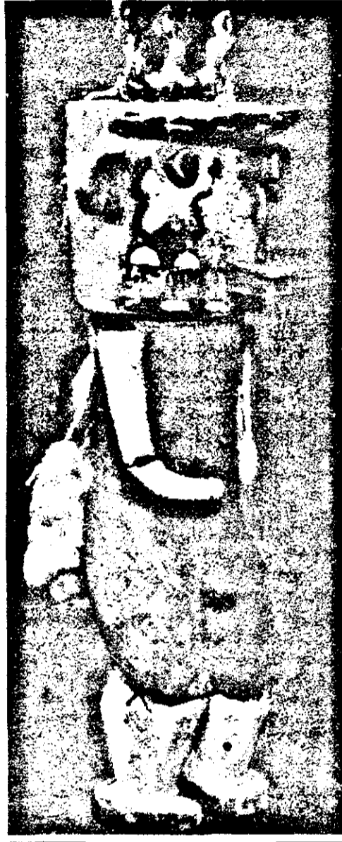
Păpușa indiană HOPI, imaginând spiritul tunetului. Linile de pe față sunt fulgerul, iar bumbacul alb de la spate sunt norii de furtună.