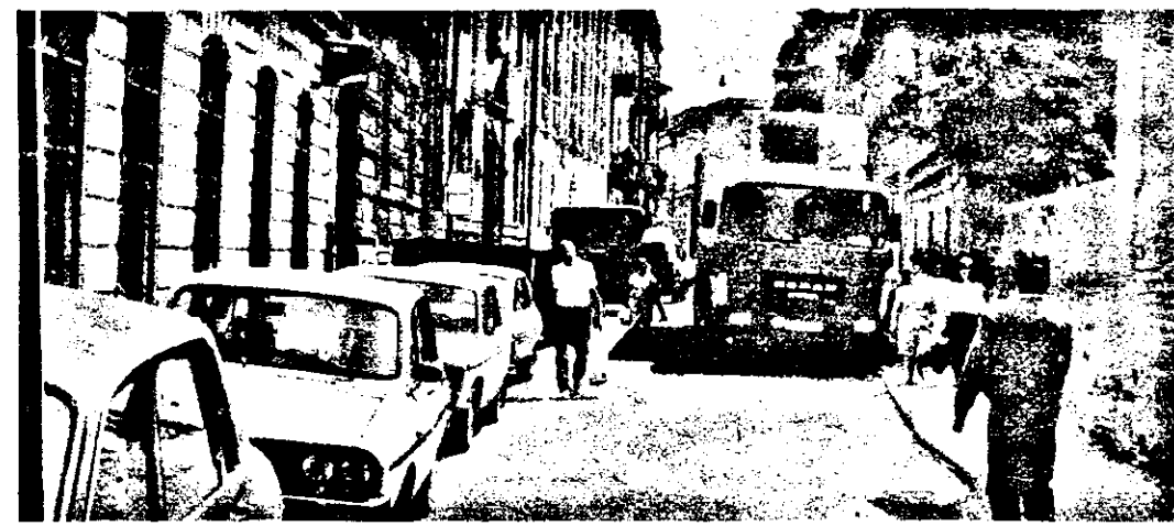
Înghesuită și încurcată ca-ntotdeauna, str.Unirii (a depozitelor cum i se mai spune). Va fi pe aici vreodată ordine?