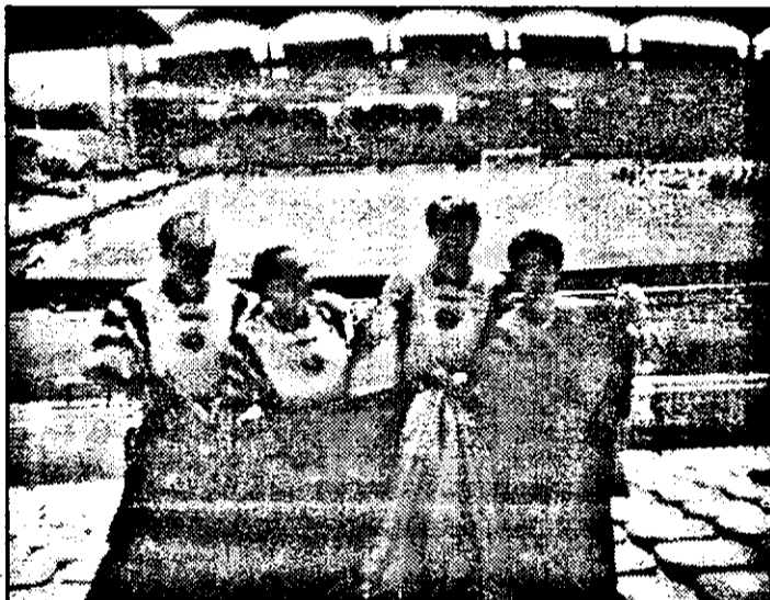
Suporteri fericiți pe „Stade Gerland” din Lyon.