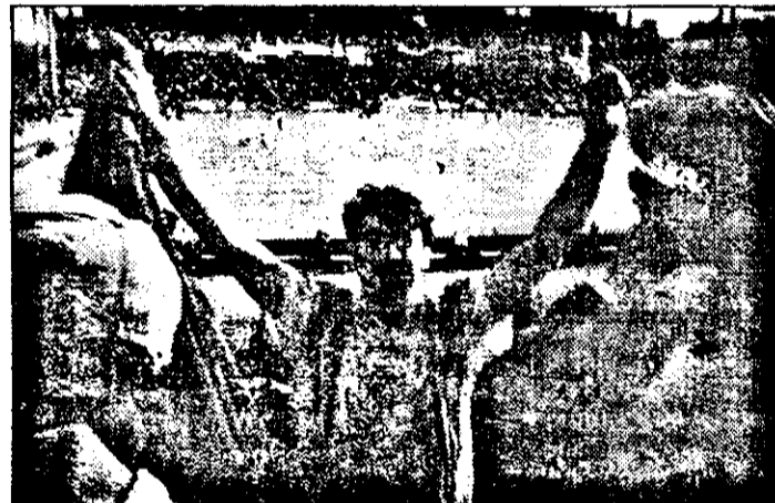
Victorie! I-am învins pe columbieni sau, bucuria unui suporter „tricolor”.