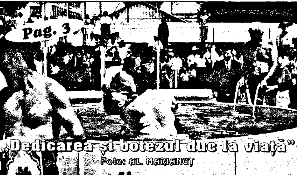
„Dedicarea și botezul duc la viață”