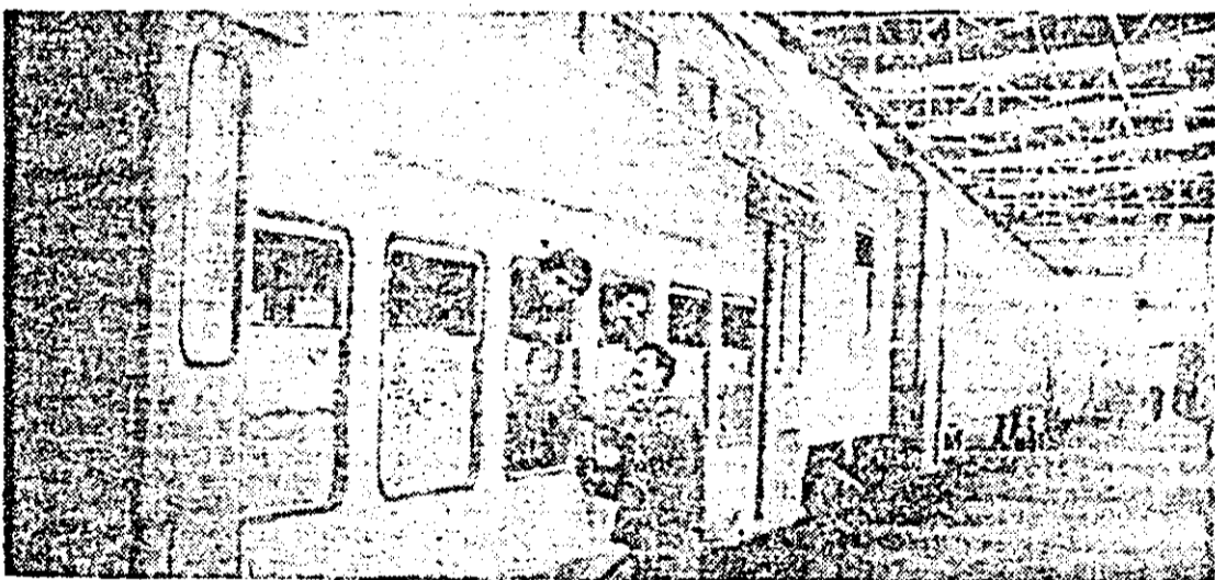
Ultimele linii și un nou lot de vagoane de călători este gata pentru a fi expedit beneficiarilor.