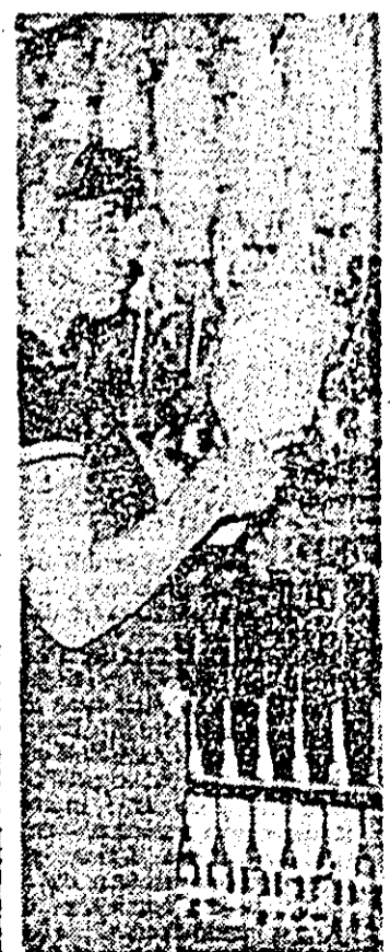
Secvență de muncă la întreprinderea textilă „UTA”.