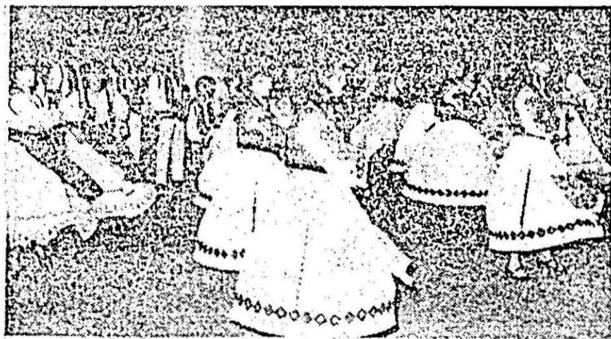
În vîrtejul dansului popular românesc.

Pe parcursul taberei, studenții participanți vor face cunoștință cu viața și activitatea curticienilor, vor face excursii de documentare în municipiul Arad, pe valea Mureșului și a Crișului Alb, toate acestea constituind veritabile surse de inspirație pentru pinzele elaborate de viitorii pictori.