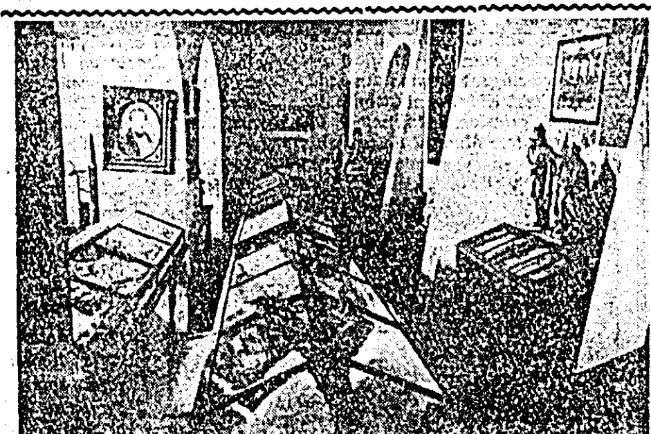
Un aspect din depozitul Muzeului regional din Arad unde se păstrează importante obiecte și documente istorice privind desășurarea revoluției de la 1848.