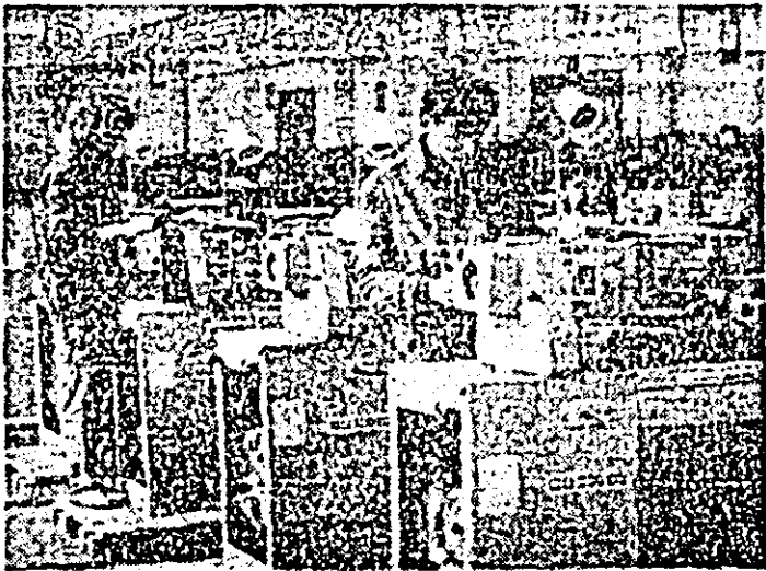
Aspect de muncă în secția montaj a întreprinderii de mașini-unelte.

de milioane lei. Reținem încă un fapt: intrarea în probe finale de lucru a strungului revolver modernizat ce execută piese de revoluție prin mecanizarea operației de manipulare și transport, anexe ce conduc la creșterea productivității utilajului și reduc efortul fizic al celui ce-l deservește.