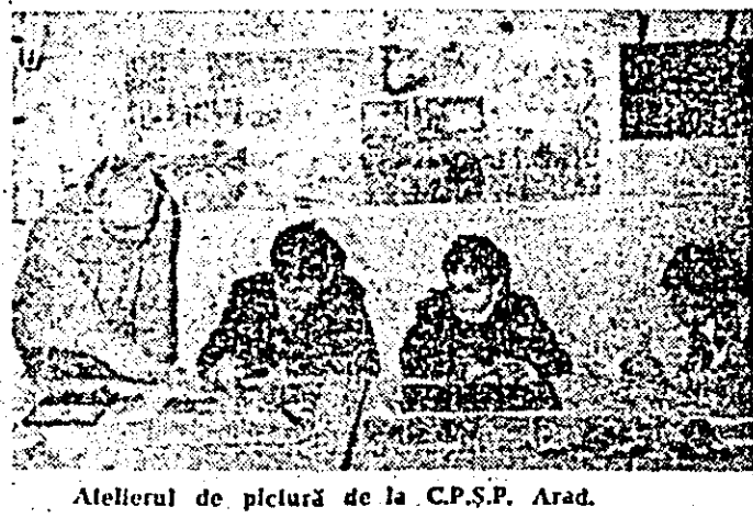
Atelierul de pictură de la C.P.S.P. Arad.