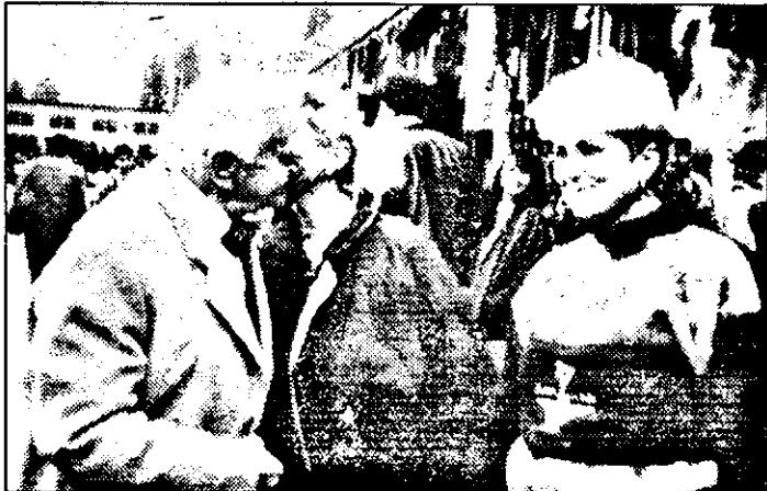
Cine a zis că Ioan Rațiu nu are succes la femei?