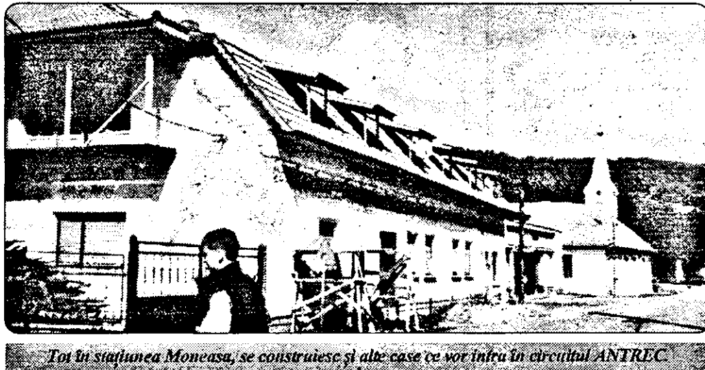
Tot în stațiunea Moneasa, se construiesc și alte case ce vor intra în circuitul ANTREC

lucrarea fiind terminată n-a mai obiectat nimic. Cabana „Dallas” are zece camere