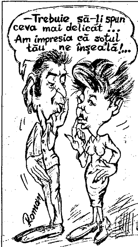
După revoluție și homosexualii își revendică drepturile lor.