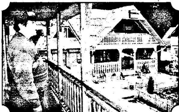
Aspect exterior al uneia dintre cabanele antrenate deja în turismul rural și agroindustrial.

și un restaurant. Materialele de construcție m-au costat 20 de milioane lei”.