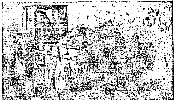
La C.A.P. „Steagul roșu” din Pecica se acordă atenție fertilizării solului cu îngrășămintele naturale.

Polosind la maximum fiecare oră bună de lucru în câmp pentru a respecta epoca optimă de însămînțat, unitățile agricole din județul nostru au semănat cu orz pentru boabe mai bine de 5000 hectare reprezentînd 20 la sută din suprafața planificată. Au raportat încheierea acestei lucrări pe întreaga suprafață prevăzută cooperativelor agricole din Malat, Bata, Teja și Vărădia.