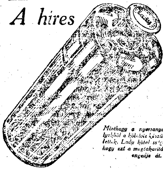
Mint hogy a nyersanyagok amelyekből a kölnivíz készül, olcsóbbak lettek, Lady kölni szíjének tartja, hogy ezt a megalkarítást továbbra engedje át.