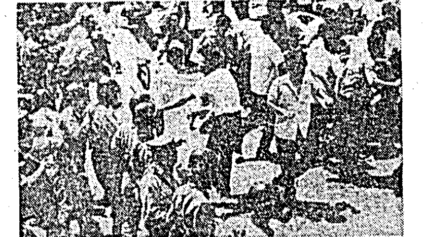
SEUL: Poliția atacă pe manifestanții care protestează împotriva recentelor algerii organizate de autoritățile sud-coreene.

SAIGON 8 (Agerpres). — Unitățile patriotice sud-vietnameze au atacat unități ale trupelor americane agresoare amplasate la sud de zona demilitarizată, la baza militară de la Con Thien, bombardată aproape zilnic, după cum relatează corespondentul agenției France Presse. Totodată, au fost lansate obuze de mortier asupra unui post al comandamentului american, situat în apropierea bazei. Atacurile patrioților, menționează agențiile de presă, au provocat pierderi unităților americane.