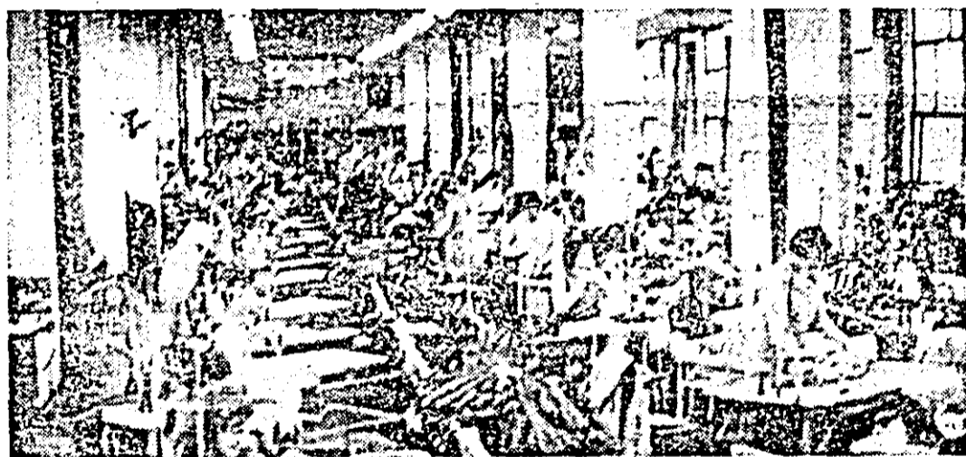
Secvență de muncă în atelierul II al Întreprinderii de confecții Arad.