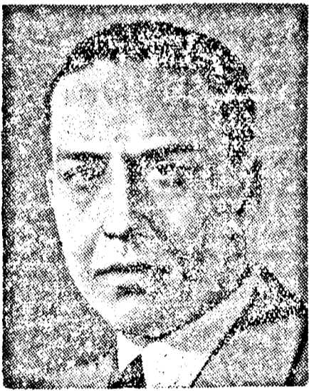
CIANO gróf, olasz külügyminiszter

Párisból jelentik: A Le Jour című jobboldali lap jelentése szerint a Potez repülőgépgyár Meaultes városában lévő telepén hét teljesen új rendszerű bombavetőgépet átfestettek és mind a hét gép ismeretlen rendeltetéssel elrepült. Hét másik kisebb típusú Potez-