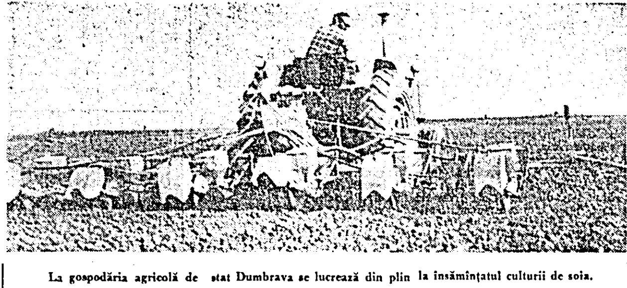
La gospodăria agricolă de stat Dumbrava se lucrează din plin la înșămînțatul culturii de soia.